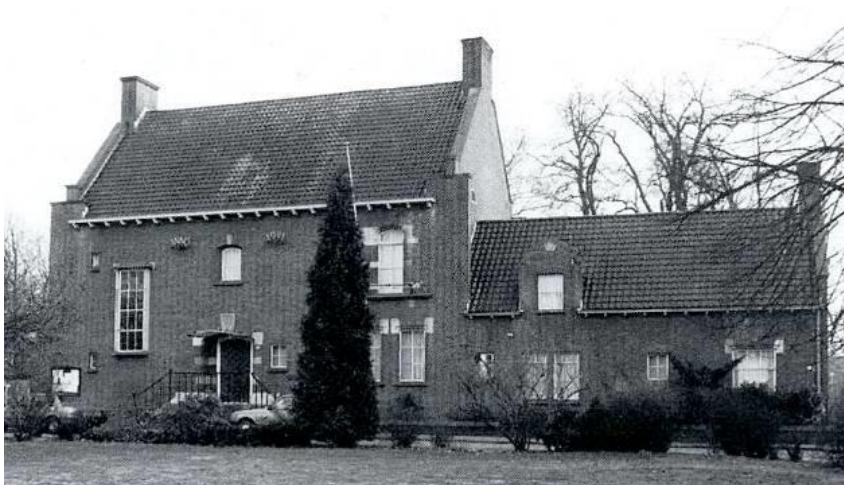
Het voormalige gemeentehuis, gebouwd in 1941.